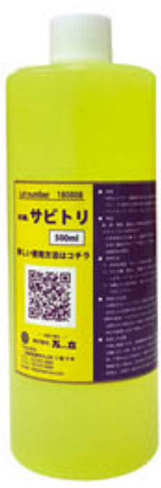
サビ取り剤 白馬 サビトリ

大きな特長としまして、従来のサビトリ洗剤は強酸の物が多いと感じますが、中性で研磨剤も含まないというものです。