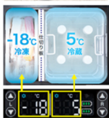
仕切り板をセットすることで、2部屋モードに自動切替。左右で異なる温度を用途に応じて設定可能。

新製品CWO04Gは、冷蔵・冷凍が一台でできる製品です！例えば、片方はマイナス18℃設定でアイス用、もう片方は5℃設定で飲み物用として使用可能です。先述の1〜4に加え、使いやすさがパワーアップいたしました。2部屋の設定温度差は最大30度まで、自由に設定可能です。インナートレイ(350mL缶3本)、庫内カゴ(2Lのペットボトルが4本)付きで収納しや