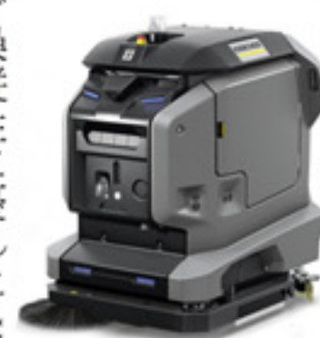
KIRA B 50