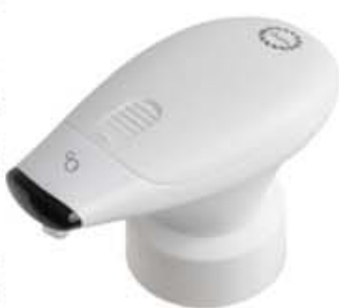
『イージーキャップ霧・泡』 荷姿：1個（各 霧・泡） 定価：3,980円（各 霧・泡）

過去3年余りに及ぶ新型コロナウイルスとの闘いもようやく終焉が近づいたかのような気が漂っている現在、マスクの着用が個々の判断となり、一方で感染者の増加に繋がらないかとの危惧する声も聞かれます。